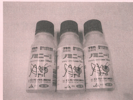
イボクサ用除草剤「ノミニー液」