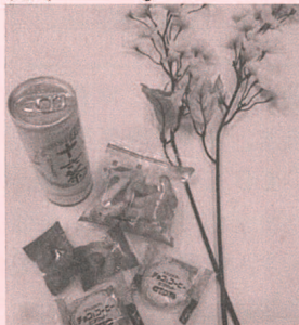
4月はお花見セットでした。

・年金受取月の15日に窓口へご来店のお客様へちょっとしたプレゼントを差し上げています。 偶数月の15日にはぜひ窓口へお越しください! なお、数に限りがありますので、お早めどうぞ。