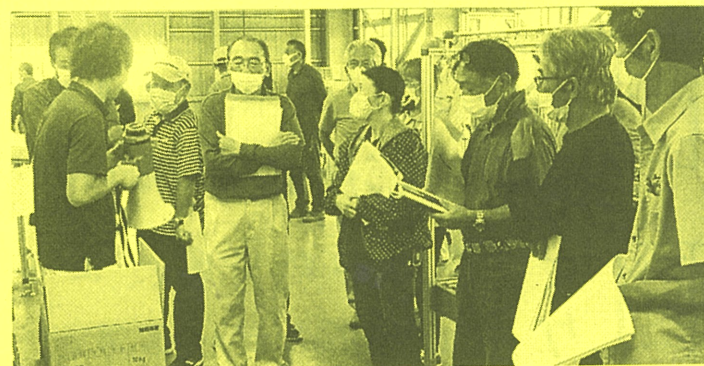
説明を受ける生産者の方々 ↑