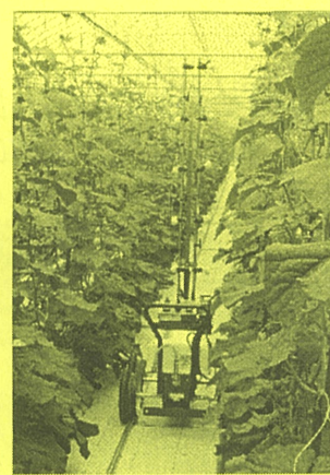
同農場に導入された無人防除機『オートランナー』 ↑