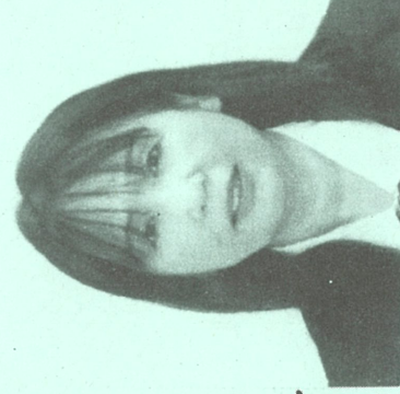
令和4年度の定期異動により3月1日より浅川支店長に就任いたしました

新型コロナウイルス感染症の収束が見通せない状況により、不安やストレスを感じる白々が続いており、皆様から信頼され、明るく、元気な支店を目指し、職員一同頑張りますので、今後とも宜しくお願い致します。