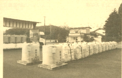
倉庫は網料米のフレコンであふれています！