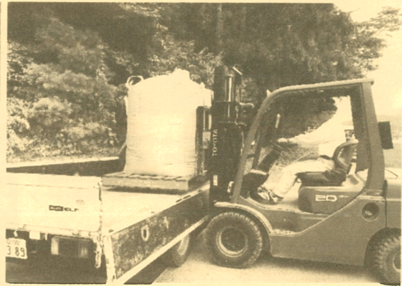
農家さん宅への産米集荷の様子！ フレコンの集荷が増えました。